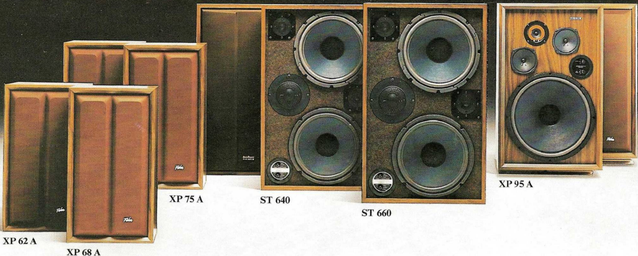
XP 62 A

Studio-Standard-Lautsprecher der Spitzenklasse. Mit akustischer Kopplung eines aktiven und eines passiven Baßlautsprechers. Damit wird ein besonders gleichmäßiger Verlauf der Wiedergabe im kritischen Baßbereich erzielt. Die Wirkung entspricht einem überdimensionalen Baßlautsprecher mit nahezu idealer Membran. Ein Mitteltonsystem strahlt nach rückwärts ab, dadurch wird die Natürlichkeit des Klangbildes erhöht. Mittel- und Hochtonlautsprecher sind regelbar. Anschlußwert 8 Ohm. Nennanschlußleistung ST 640 70 Watt Nennanschlußleistung ST 660 120 Watt Abgestimmt auf die Receiver RS 1058 bis RS 1080 und Verstärker CA 2310