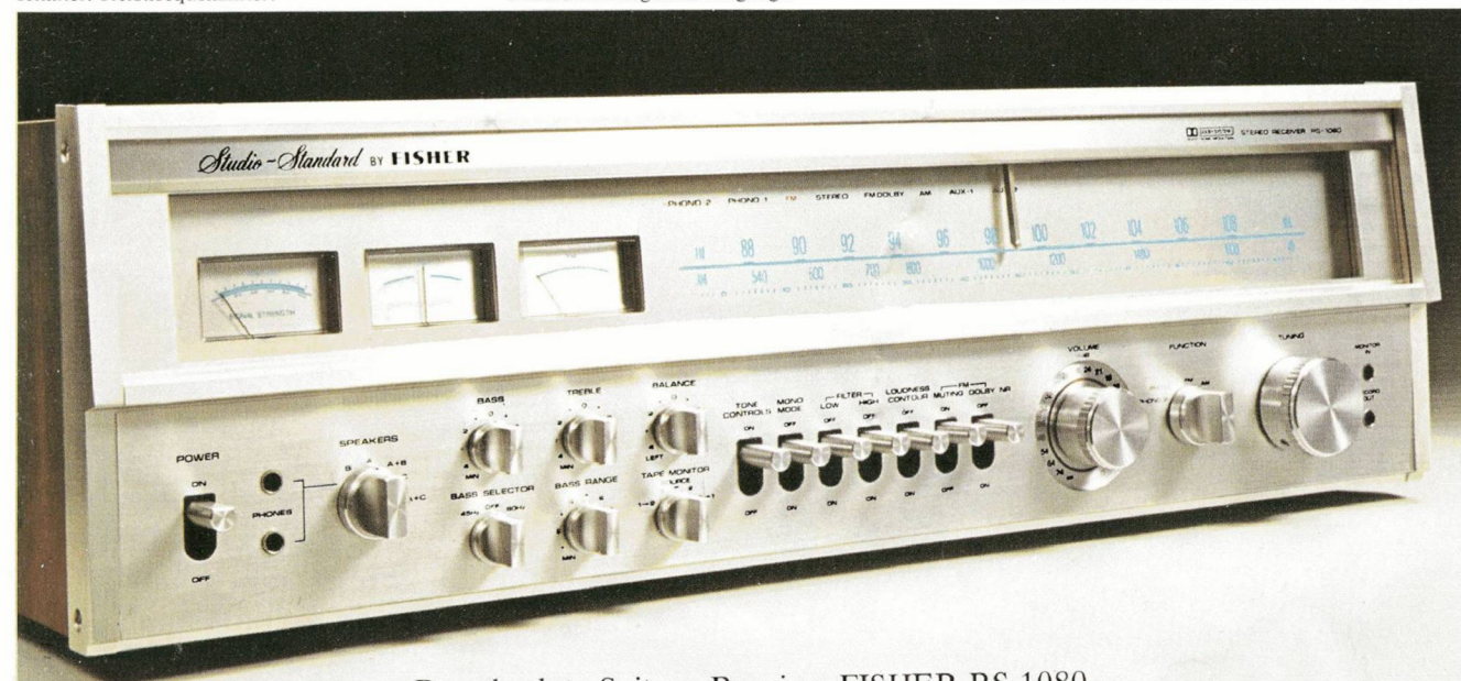
Der absolute Spitzen-Receiver FISHER RS 1080

RS 1080 2 × 190 Watt Sinus Unser Formel-I-Receiver. Mit der Kraft, die sich HiFi-Enthusiasten wünschen. Der RS 1080 ist der absolute Spitzenreceiver. Auch im kommerziellen Einsatz. Es gibt nichts von Bedeutung in der Receiver-Technik, das der RS 1080 nicht hätte. Multipath-Anzeige und UKW-Dolby sind eingebaut. Großzügige Auslegung des Netzteiles sichert die Betriebsbereitschaft bei langdauernder voller Leistungsabgabe. Wenn Sie wissen wollen, was Receiver leisten können – hören Sie den RS 1080.